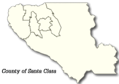
County of Santa Clara

Gradske agencije i uredi pomazu stanovnicima u oslovljavanju problema koji su povezani sa gradom, kao na primjer; problemi sa vodom i strujom, policijom, vatrom i parkovima.