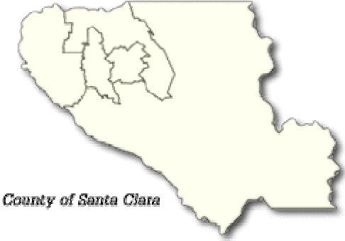
County of Santa Clara

ក្រសួងក្នុងទីក្រុង និងមុខក្រសួងទាំងអស់ អាចជួយអ្នករស់នៅទីនោះ ក្នុងការបង្ហាញដោះស្រាយ ដែលទាក់ទងទៅនឹងទីក្រុងដូចជា ចំណុចរឿងពី ទឹក ភ្លៀស ប៉ូលីស ភ្លើងអេះ និងកន្លែងស្នូនលេងកំសាន្ត។