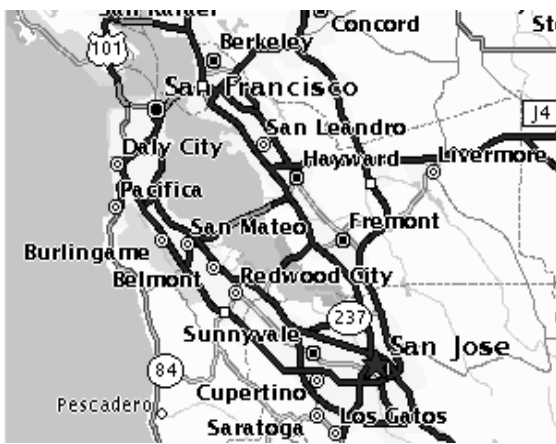
ការគ្រប់គ្រងទីក្រុង

តើការគ្រប់គ្រងទីក្រុងមានរបៀបយ៉ាងណា? ទីក្រុង មានការគ្រប់គ្រង ដោយករណៈកម្មាធិការមួយ មានឈ្មោះថា City Council។ អ្នកដែលបានជ្រើសរើសឡើងធ្វើការនេះ អាចជា ដំណាងសង្កាត់ខ្លះ ឬក៏អ្នករស់នៅជិតខាងក្នុងទីក្រុងនោះ ឬក៏គេអាច ជាដំណាងនៃទីក្រុងទាំងមូលតែម្តង។ ជាមួយគ្នានេះដែរ អ្នកដឹកនាំ ទាំងនេះ ត្រូវតែធ្វើច្បាប់ និងធ្វើសេចក្តីសំរាប់ការធំៗ ដែលមានប៉ះ ពាល់ដល់ការរស់នៅ របស់យើងទាំងអស់គ្នា។ ទីក្រុងនីមួយៗអាច មាន មេដឹកនាំម្នាក់ ដែលជ្រើសរើសដោយសា ការបោះឆ្នោតទូទៅ អ្នកនោះមានឈ្មោះថា ចៅហ្វាយក្រុង Mayor ។ ចៅហ្វាយក្រុង គឺជាមន្ត្រីធំ ដែលទទួលខុសត្រូវធ្វើកិច្ចការ សំរាប់នៅក្នុងទីក្រុងនោះ ខ្លាហារណ៍ ដូចជាប្រធាននៃប្រទេសទាំងមូល។